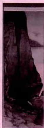
日本画「山陰香住海岸」(軸装)